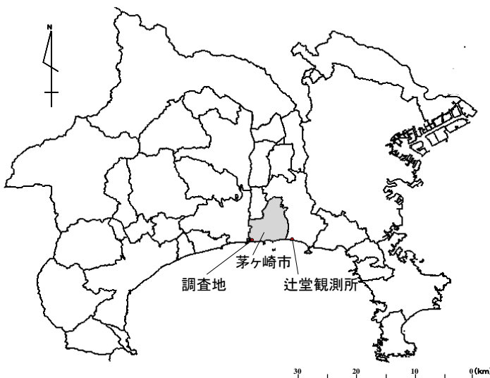
図 1 神奈川県全体図 茅ヶ崎市位置

茅ヶ崎市文化資料館 Chigasaki City Museum Of Heritage